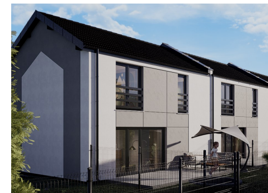
widok od ogrodu