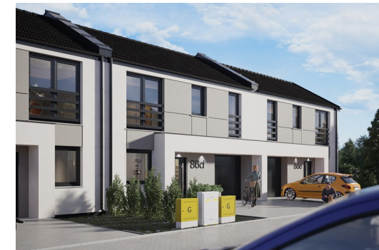
widok od frontu